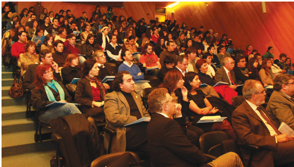
O plano de acção da rede integra a educação, o empreendedorismo social e articulação das linhas de financiamento.