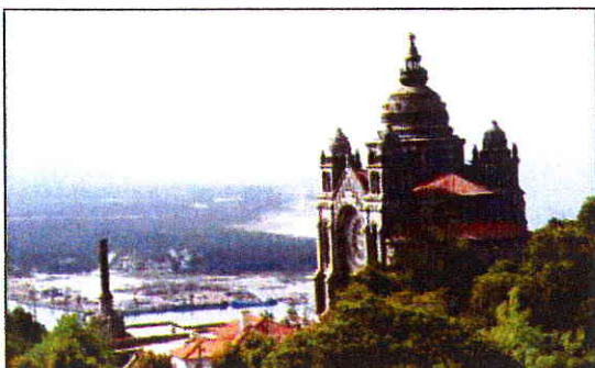
Santa Luzia, uno de los iconos de Viana do Castelo.

Diseñadores y artistas presentan su obra por todos los puntos de la ciudad. En el certamen participan prestigiosos expertos de renombre mundial