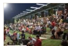
IV Feira do Cavalo de Ponte de Lima - 26 de Junho 2010