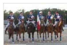
IV Feira do Cavalo de Ponte de Lima - 27 de Junho 2010