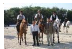
IV Feira do Cavalo de Ponte de Lima